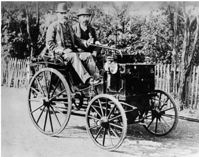
Panhard Levassor - 1891