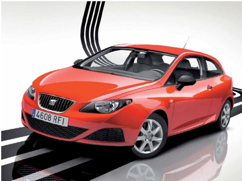
Seat Ibiza- 2009