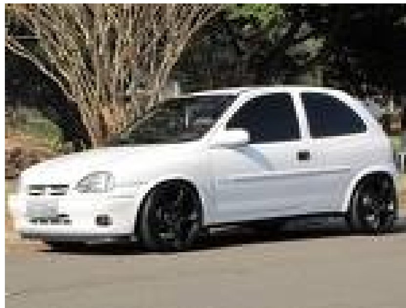
Opel Corsa B - 1993