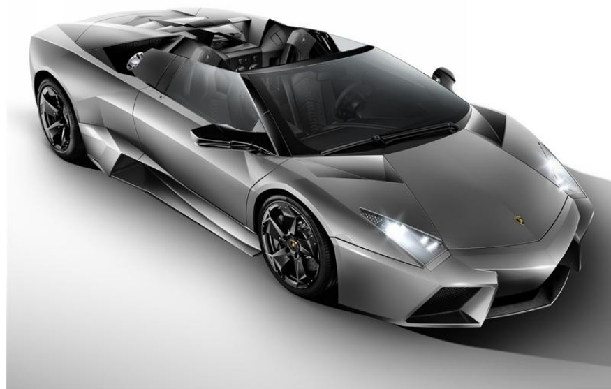
Lamborghini-Reventon - 2010