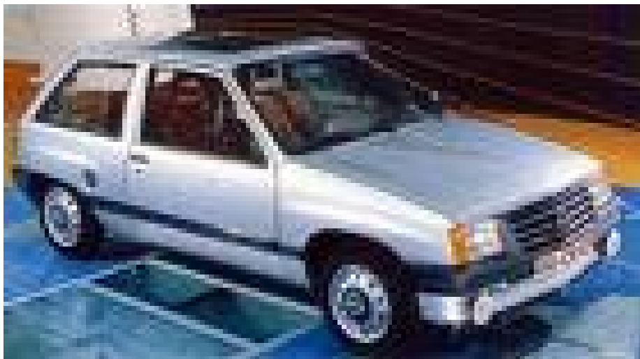
Opel Corsa A - 1983